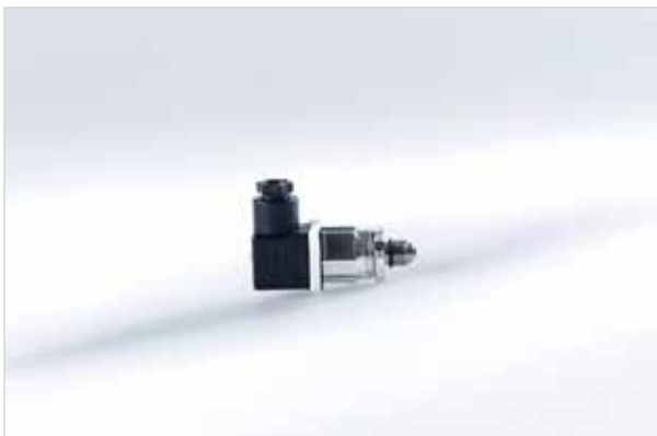
用于制冷剂应用的压力变送器

该LiquiSonic®分析仪包括一台压力传感器以确定压力补偿浓度。在控制器中，通过4-20 mA的模拟信号供给和释放压力。