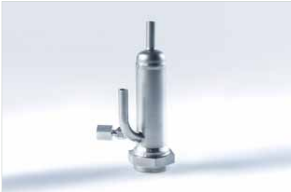
用于制冷剂应用的流量接头

该流量接头十分适合用于将传感器轻松集成于该工艺，并可用于多种设计。其入口和出口为直径（OD）12mm 的标准管，因此可用于装配合适的配件。另外，该接头可集成于压力传感器。