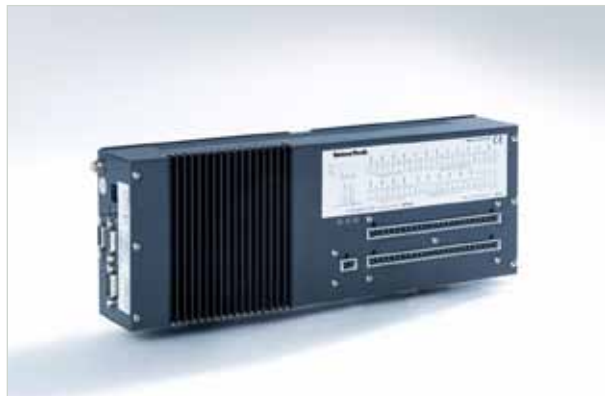
用于OEM制冷剂应用的LiquiSonic®控制器5

由于轨道安装节省空间，该控制器5被设计为车辆设备及测试平台集成的OEM装置。除了常规接口，该控制器5还包括通过控制器局域网总线进行集成。电源为24 V DC ( \pm 15\% )。另外，还可选10 - 32 V DC的大功率电源。