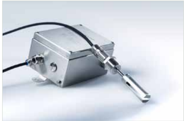
用于油/制冷剂混合物的LiquiSonic®浸入式传感器