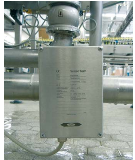
Am Füller misst der Sensor kontinuierlich den Plato- oder Brixgehalt von insgesamt 30 Produkten während der Abfüllung.